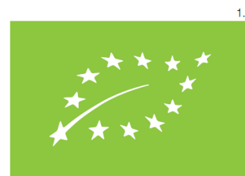
Pantone 376 | C050:M000:Y100:K000