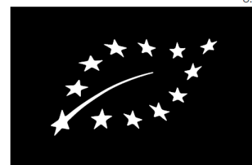
Permitted black and white